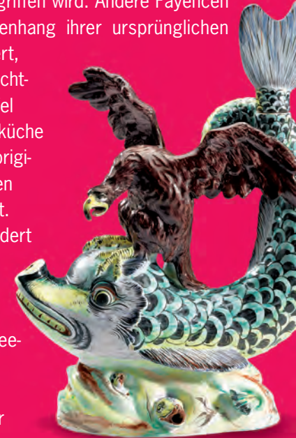
Tischbrunnen Manufaktur Holitsch um 1760

Diverse Artikel für die aufwendige Morgentoilette feiner Herrschaften illustrieren die Rolle, die Fayencen auch für Hygiene und Schönheitspflege spielten. Begegnen Sie zahllosen Beispielen von faszinierender Kunstfertigkeit und Kreativität!