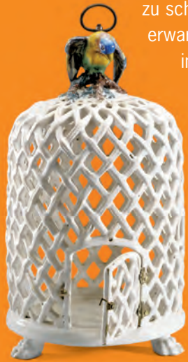
Vogelkäfig Manufaktur Hannoversch- Münden, um 1760

zu schauen lohnt sich! Den Besucher erwartet ein einzigartiges Museum, in dem die Welt der deutschen Fayence des 17. und 18. Jahrhunderts präsentiert wird. Der Ausstellungsrundgang bietet mit rund 1000 Exponaten auf fast 900 Quadratmetern einen lebendigen Überblick über Geschichte und Technik der Fayence, informiert über Produktionsweise und Produkte der Manufakturen und macht die Bedeutung der Fayence für die Tafel- und Wohnkultur der Zeit anschaulich. So wird nachvollziehbar, warum die Fayence damals so weit verbreitet und wichtig war. Mitmach-Stationen für Groß und Klein, spielerische und sinnliche Elemente und Inszenierungen regen zum genauen Hinsehen und Ausprobieren an.