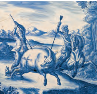
Teetischplatte (Ausschnitt) Manufaktur Nürnberg 1720-30

sind Reste von wiederentdeckten und jüngst restaurierten Wandmalereien des 18. Jahrhunderts zu bewundern. Deren Landschaftsdarstellungen bilden