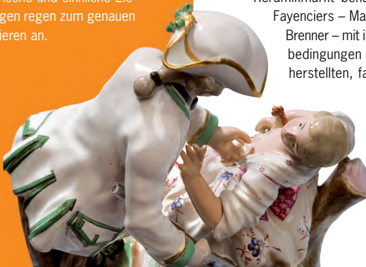
Jäger mit Dame (Ausschnitt) Manufaktur Niederweiler um 1770

zu schauen lohnt sich! Den Besucher erwartet ein einzigartiges Museum, in dem die Welt der deutschen Fayence des 17. und 18. Jahrhunderts präsentiert wird. Der Ausstellungsrundgang bietet mit rund 1000 Exponaten auf fast 900 Quadratmetern einen lebendigen Überblick über Geschichte und Technik der Fayence, informiert über Produktionsweise und Produkte der Manufakturen und macht die Bedeutung der Fayence für die Tafel- und Wohnkultur der Zeit anschaulich. So wird nachvollziehbar, warum die Fayence damals so weit verbreitet und wichtig war. Mitmach-Stationen für Groß und Klein, spielerische und sinnliche Elemente und Inszenierungen regen zum genauen Hinsehen und Ausprobieren an.